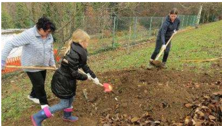
Izdelava visoke grede v obliki kostanjevega lista